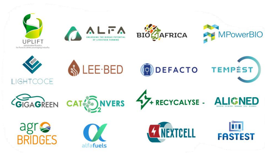
Imagen 1: 1Algunos logotipos de proyectos europeos de Sustainable Innovations

En Sustainable Innovations combinamos muchos factores de éxito para impulsar nuestros proyectos más allá de: (i) el conocimiento adquirido tras varios años de investigación documental y mapeo de innovaciones, (ii) las modernas herramientas que nos permiten estar actualizados en términos de estado de la técnica, (iii) las bases de datos que nos mantienen al tanto de las oportunidades de financiación más relevantes y, por último, pero no menos importante, (iv) un equipo comprometido que siempre está dispuesto a adoptar nuevas perspectivas para ofrecer las mejores soluciones a nuestros socios.